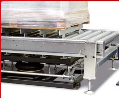
Pallet Lifter Releveur de charges

Système de pré-étirage motorisé du polyéthylène. La bobine peut être une Jumbo 40 kg pour une autonomie 3 fois supérieure à une standard. Photo ci-dessus THE RING MPS à 2 bobines.