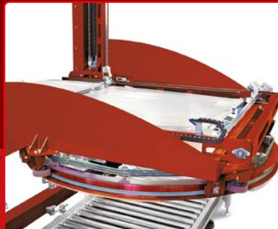
The RING PRS with TOP COVER The RING MPS avec dépose de coiffe