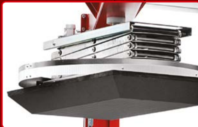
Various types of top pressure units Types de presseur variés

Motorized pre-stretch with pre-stretch ratio variable with two motors Pré-étirage motorisé avec ratio de pré-étirage variable avec deux moteurs